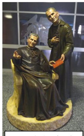
新豎立在羅馬慈幼會總部的鮑聖與盧華像