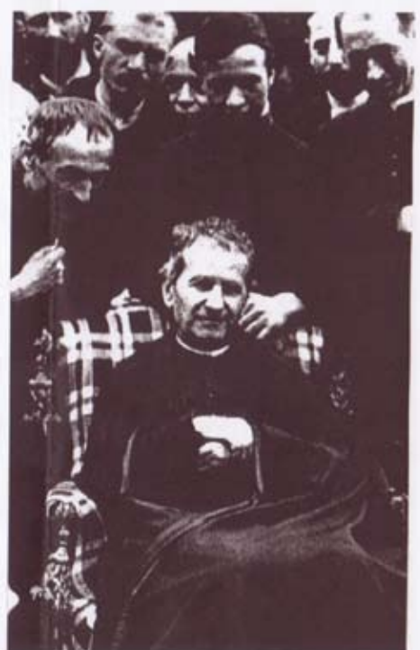
FESTA DI DON BOSCO - 1998 Basilica di Maria Ausiliatrice - Torino

Foto originale di Don Bosco - Barcellona, 3 maggio 1886