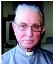
謝維道神父 意大利羅馬