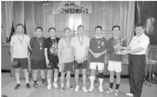
葉建昌會長與得獎者合照

2010年一月卅一日舉行舊同學回校日，如同往年一樣，參加同學十分踴躍，有四百多人。當日除了球類比賽外，一眾還到大修院探望在那兒靜養的多位神長。